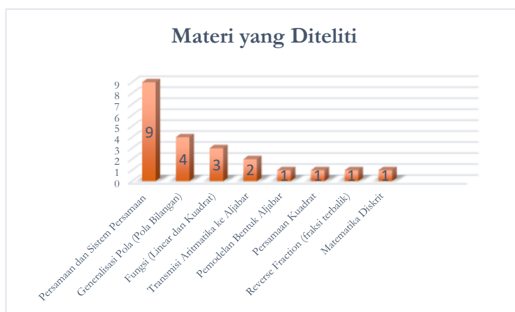
Gambar 2. Bidang aljabar apa saja yang sudah diteliti

Perbedaan indikatornya adalah berpikir aljabar umumnya meliputi generalisasi, abstraksi, pemodelan, penggunaan simbol, dan analisis struktur matematis. Bernalar aljabar lebih terstruktur, seperti menemukan pola, membuat konjektur, membuktikan generalisasi, dan menyimpulkan dengan logika induktif/deduktif. Indikator berpikir aljabar yang sering muncul meliputi kemampuan membuat model matematis dari permasalahan kontekstual, penggunaan simbol dengan tepat, generalisasi terhadap pola atau struktur aljabar. Sementara itu, indikator bernalar aljabar mencakup kemampuan mengenali dan menghubungkan pola, menyusun dugaan ( conjecture ), menguji kebenaran dan membuat justifikasi logis. Beberapa artikel misalnya (Yunarti & Amanda, 2022) menjelaskan indikator bernalar aljabar berdasarkan teori reasoning dari (Lithner, 2008), sedangkan indikator berpikir aljabar banyak merujuk pada kerangka teori berpikir aljabar yang dikembangkan oleh (Kieran, 2004), yang menekankan aspek generalisasi, representasi simbolik, dan pemahaman struktur aljabar.